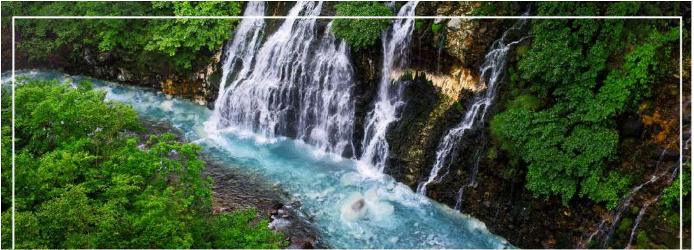
SHIRAHIGE WATERFALL น้ำตกชิราฮิเกะ

วันที่สอง ทำอากาศยานนิวซีโตเสะ สอกโกโต – เมืองบิเอะ – น้ำตกชิราฮิเกะ – สระอะโออิเคะ หรือ ป่อน้ำสีฟ้า – เมืองอาซาฮิคาว่า – อีออน อาซาฮิคาว่า