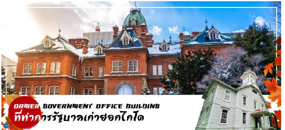
FORMER GOVERNMENT OFFICE BUILDING ที่ทำการรัฐบาลเก่าซอกไกโด

จากนั้นผ่านชม หอนาฬิกาเมืองซัปโปโร (Sapporo Clock Tower หรือภาษาญี่ปุ่นเรียกว่า Sapporo Tokeidai) เป็นหอนาฬิกาโบราณมีลักษณะเป็นอาคารไม้ที่มีหลังคาสีแดงและผนังสีขาว ถูกออกแบบและบริจาคให้โดยรัฐบาลสหรัฐอเมริกา ในปี ค.ศ. 1878 เป็นสัญลักษณ์ทางวัฒนธรรมและประวัติศาสตร์ของเมืองซัปโปโร สำหรับตัวนาฬิกาถูกติดตั้งในปี ค.ศ. 1881 จากบริษัท E. Howard & Co. เมือง Boston และในปี ค.ศ. 1970 หอนาฬิกาแห่งนี้ถูกกำหนดให้เป็นทรัพย์สินทางวัฒนธรรมที่สำคัญแห่งชาติ อีกด้วย